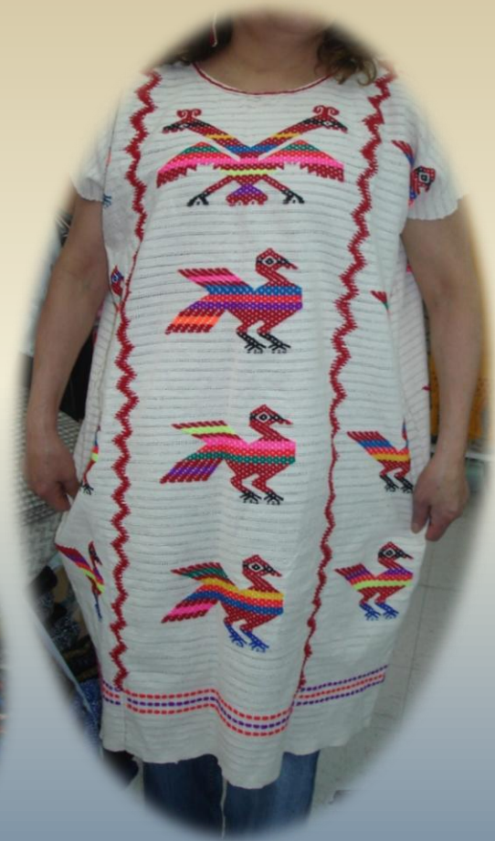
Huipiles y Blusas hechos en telar, bordados en punto de cruz