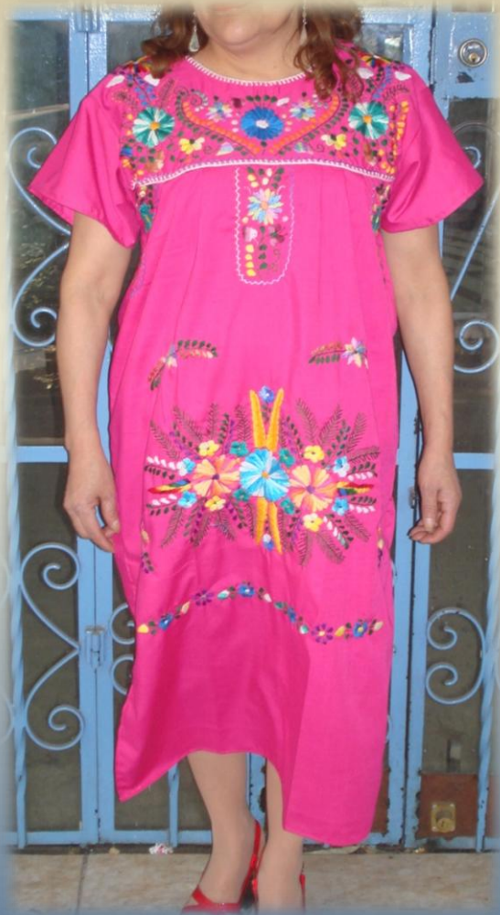
Vestido Bordado en Algodón